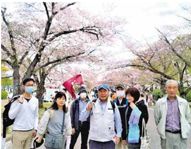
楽しく集えてワイワイできるのが何より