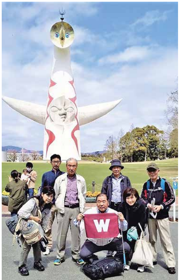
太陽の塔をバックに。心おきなく多く参加できますように

だっ広い園内では、日本庭園の散策に時間をかけました。ボランティアガイドさんに案内してもらい、非対称の樹木配置や凝った石橋、借景の妙、風景に溶け込んだ剪定松、茶室の侘びさびなどをじっくり鑑賞しました。太陽の塔の内部の見学も楽しめ、コロナ禍で疲れた心身をじっくり癒すことができました。恒例の終わってからの一献は自粛し、晴れて存分に杯を傾ける日が来ることを願い、公園を後にしました。