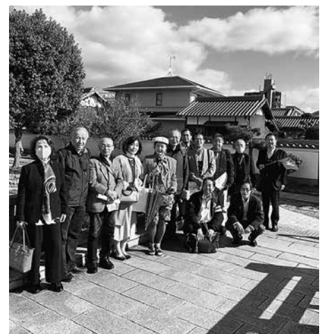
3密対策を施して開催のハイキング （2020年11月 大和郡山）