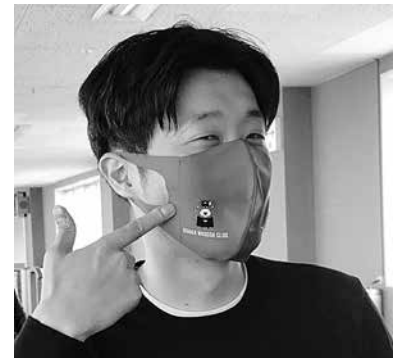
倶楽部でつくったオリジナルマスク