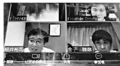
ZOOMの画面で講演を聞く

また、講演のあとは、ZOOMを通して参加者同士の画面上の懇親が行われました。3人ずつの組になって画面上で近況報告や講演の感想などを相互に話しました。10分ほどでメンバーの組み替えをし、約30分間でしたが久々の交流を果たしました。