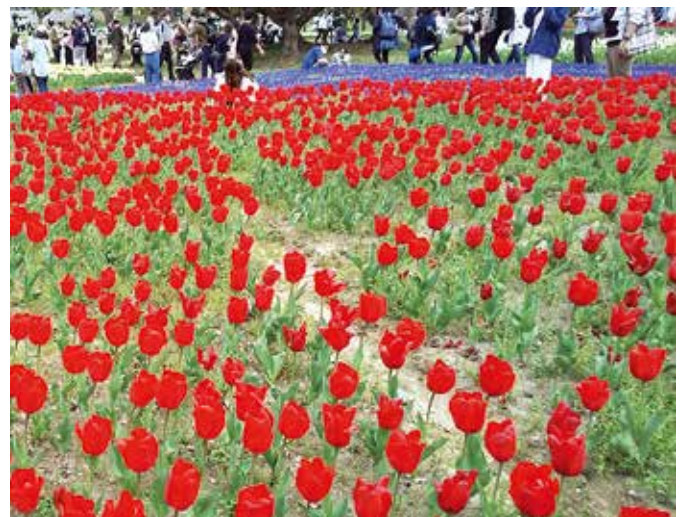
桜は見ごろを過ぎて、チューリップが満開でした