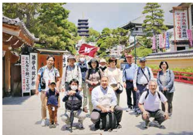
早い梅雨入りでしたが、お天気は満点

ようやく昆陽池公園に到着。ここからは自由時間となり、野鳥観察をメインにする人、併設されている昆