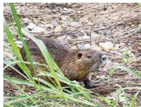
ヌートリアの出現にびっくり

自然を見ながらいっぱい歩いて、皆さんと気さくなお話も弾み、とっても楽しい一日でした。ストレス解消で免疫力もアップ。コロナ禍ではありますが、感染対策をしっかりして、これからもハイキング部会の企画を楽しんでいけたらと願っています。