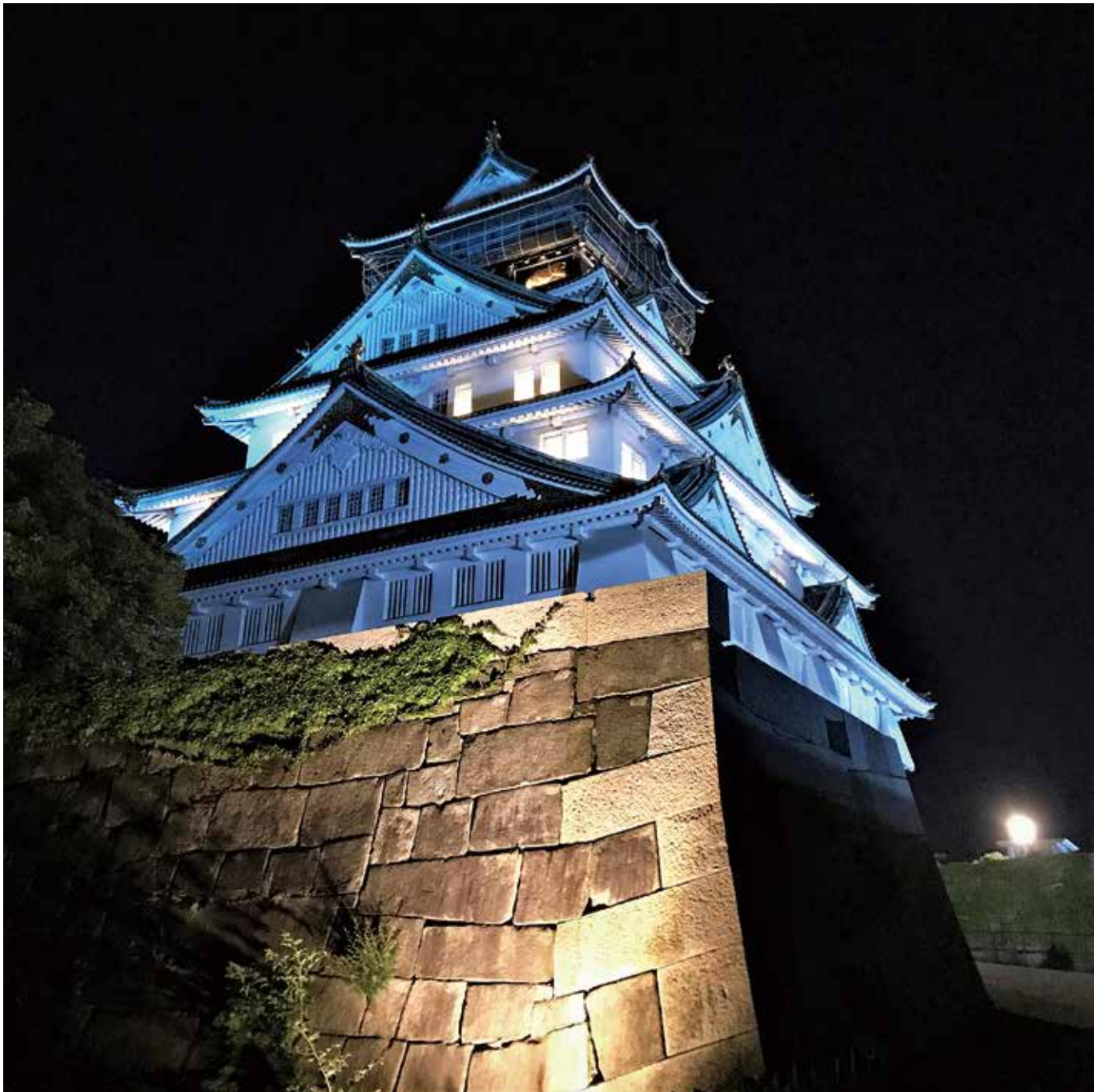
コロナ禍で医療従事者への感謝の念でブルーにライトアップの大阪城